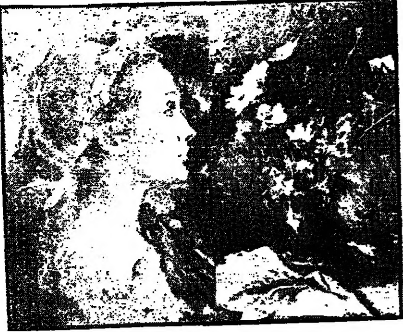
لوحتان بريشة الفنان المصري صبري راغب (زهور) و «وجه»